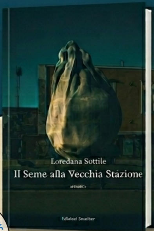
Il Seme alla Vecchia Stazione